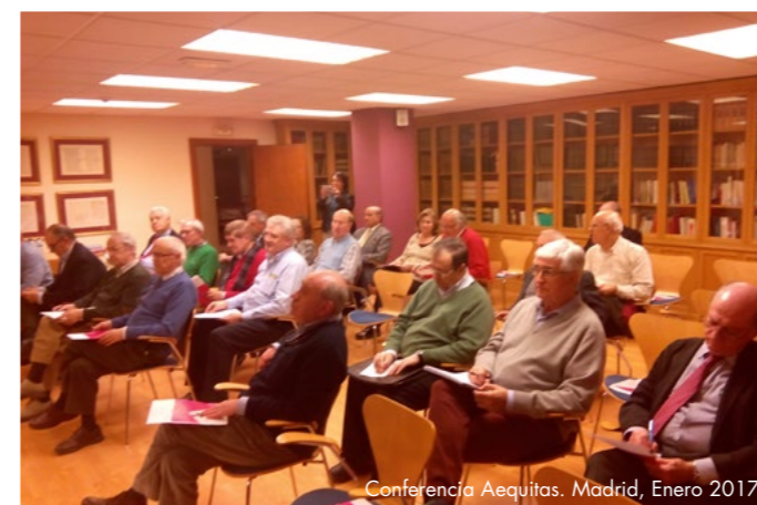
Conferencia Aequitas, Madrid, Enero 2017