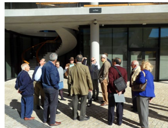
Ciudad BBVA Octubre 2017.