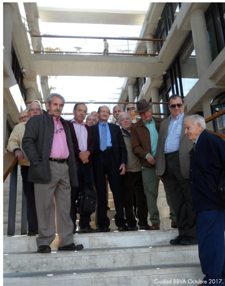
Ciudad BBVA Octubre 2017.