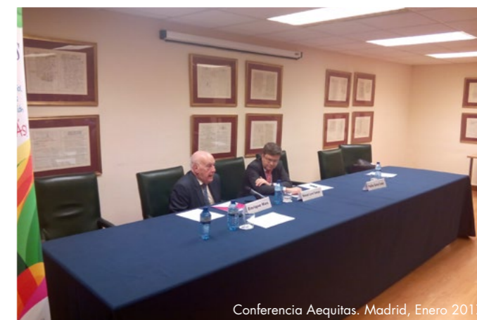
Conferencia Aequitas, Madrid, Enero 2017