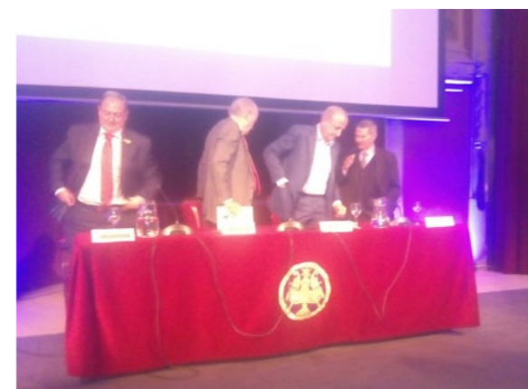
Ateneo, Abril 2017