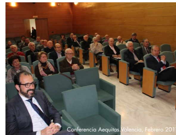
Conferencia Aequitas, Valencia, Febrero 2017

En el caso de Valencia, celebrada en el marco del Colegio Notarial, y que registró una excelente asistencia gracias a la excelente labor de nuestro