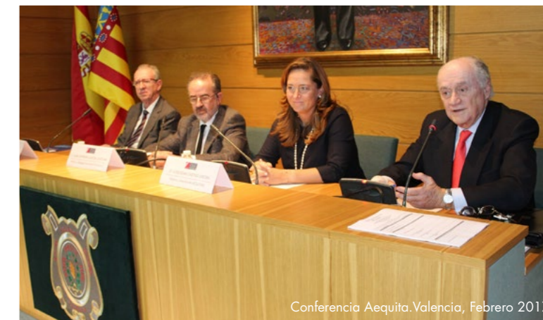
Conferencia Aequita, Valencia, Febrero 2017